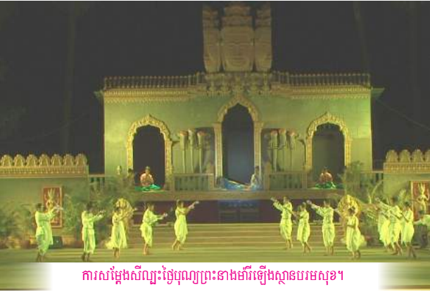
ការសម្តែងសិល្បៈថ្ងៃបុណ្យព្រះនាងម៉ារីឡើងស្ថានបរមសុខ។

កាលពីថ្ងៃទី១៩ ខែសីហាឆ្នាំ២០១៧ កន្លងទៅព្រះសហគមន៍កាតូលិក សន្តីម៉ារីញញឹម ចំការទៀង ស្ថិតនៅភូមិចំការទៀង ខេត្តកែវ បានប្រារព្ធពិធីបុណ្យព្រះជាម្ចាស់លើកព្រះនាងម៉ារីឡើងស្ថានបរមសុខ។