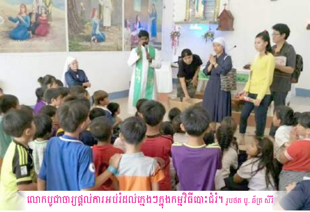
លោកបូជាបាប្យជួយការអប់រំដល់ក្មេងៗក្នុងកម្មវិធីបោះជំរុំ។

A local Church organized a camp for about 60 children from the 2nd to 6th August 2017 at Svay Pak. The camp brought together children from the Churches in Kilometer 11, SenSok and PrekTaten. The camp was facilitated Sr. Lavan, a nun from the congregation of the Sacred Heart of Jesus Sisters from Bangkok, Thailand, who also taught the Bible to them.