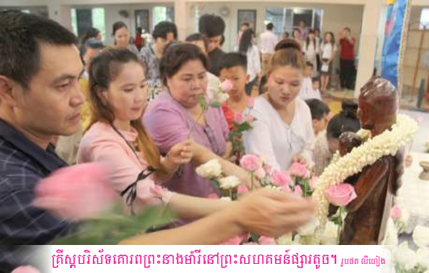
គ្រីស្ទបរិស័ទគោរពព្រះនាងម៉ារីនៅព្រះសហគមន៍ផ្សារតូច ១ រូបភាព លើយូធូប