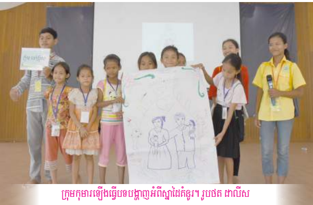
ក្រុមកុមារឡើងធ្វើបទបង្ហាញអំពីស្នាដៃគំនូរ។

In particular, he noticed the fervor in them when attending daily prayers. The coordinator added that this was the way of leading them to have a good lifestyle in the family and society alike. The camp brought together 50 children from Boeung Tompun Church, 50 from Boeung Trabek and 60 both from Toutaing and Koh Noria.