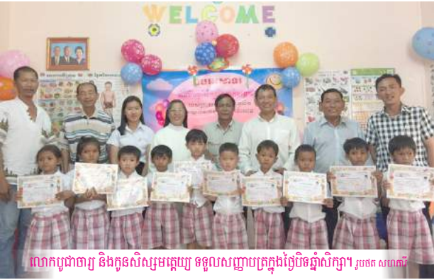
លោកបូជាចារ្យ និងកូនសិស្សមត្តេយ្យ ទទួលសញ្ញាបត្រក្នុងថ្ងៃវិទ្យាសិក្សា។

សាលាមត្តេយ្យសន្តម៉ាទ័រ និងទទួលកុមារដែលមានអាយុ ចន្លោះពី៤ទៅ៦ឆ្នាំ ឲ្យចូលរៀននៅថ្នាក់មត្តេយ្យសិក្សានាឆ្នាំ សិក្សា២០១៧-២០១៨ នាខែកញ្ញាខាង មុខនេះបន្តទៀត។