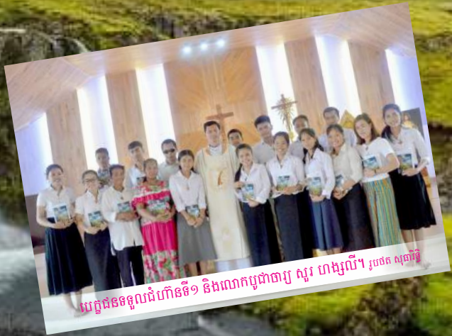
បេក្ខជនទទួលជំហានទី១ និងលោកប្រធានាឡ ស្ករ ហង្សលី។