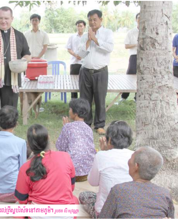
លក្ខិស្តបរិស័ទនៅតាមភូមិ។

likened to the city of Jerusalem, where Catholics proclaim the Gospel to other people by works of charity.