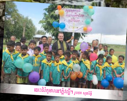
ធានាជំរុំការនៅភ្នំរល្លី។