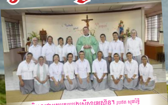
លោកអភិបាលជាមួយក្រុមបងស្រីសាឡេរីន។