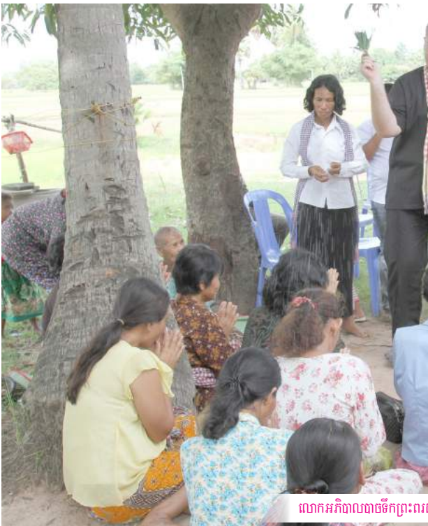
លោកអភិបាលបាចទឹកព្រះពរ

បន្ទាប់មកបងប្អូនទាំងអស់ រួមជាមួយលោកបូជាបារ្យ លោកអភិបាល ចូលរួមអភិបូជាបារ្យនៅព្រះវិហារសន្តប៉ូល