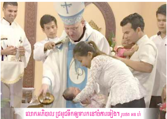
លោកអភិបាល ប្រមូលទឹកឲ្យទារកនៅចំការទៀង។

Following the Eucharist, all participants watched an artistic show on the story of a wedding ceremony. The show was performed by a troupe of the parish.