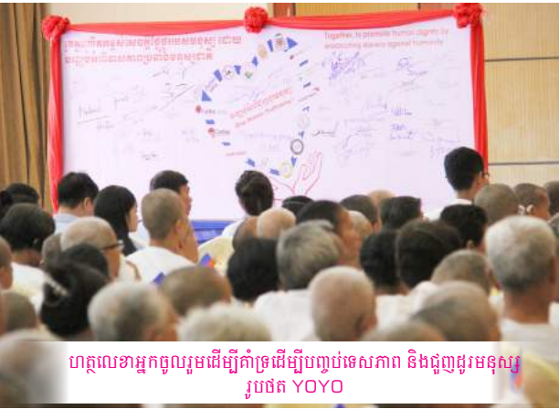
ហត្ថលេខាអ្នកចូលរួមដើម្បីគាំទ្រដើម្បីបញ្ចប់ទេសភាព និងជួញដូរមនុស្ស រូបថត YOYO

នៅចុងបញ្ចប់នៃកម្មវិធី សាសនាទាំងអស់រួមជាមួយ តំណាង រាជរដ្ឋាភិបាល អង្គការសង្គមស៊ីវិល និងយុវជនយុវនារី បាន កាន់ទៀន និងសារដង្ហែតាមផែនរៀងៗខ្លួន និងបង្ហោះសារ ព្រមៗគ្នា ក្នុងអត្ថន័យប្តេជ្ញាក្នុងការប្រយុទ្ធប្រឆាំងនឹងការជួញ ដូរមនុស្ស ។