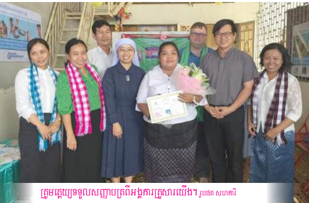
គ្រូបង្ហាញទទួលសញ្ញាបត្រពីអង្គការគ្រួសារយើង។

សំណួរ ឲ្យក្មេងចាប់អារម្មណ៍ និងចង់រៀនសូត្រ។ ចេះជ្រើសរើស សម្ភារៈនៅពេលបង្រៀន បង្កើតសោភ័ណភាពក្នុងបន្ទប់រៀន ឬក្នុងសាលា និងជាចុងក្រោយបំផុតគឺ ការចូលវគ្គបណ្តុះបណ្តាលនេះត្រូវចេញពីការប្តេជ្ញាចិត្តដោយខ្លួនឯង ដោយមានចិត្តចង់ជួយកូនក្មេងឲ្យមានការរីកចម្រើន។