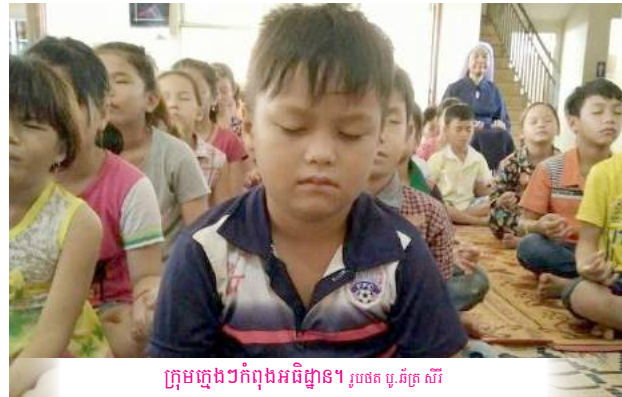
ក្រុមក្មេងៗក្នុងអធិដ្ឋាន។