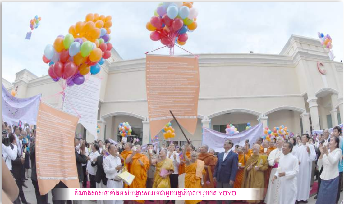
តំណាងសាសនាទាំងអស់បញ្ចុះសារូមជាមួយរដ្ឋាភិបាល។