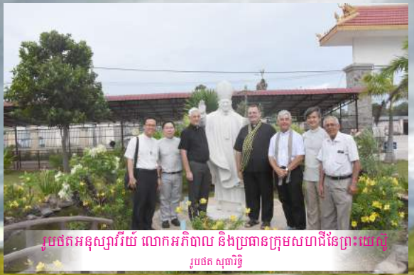
រូបថតអនុស្សារីយ័ លោកអភិបាល និងប្រធានក្រុមសហជីវនៃព្រះយេស៊ូ