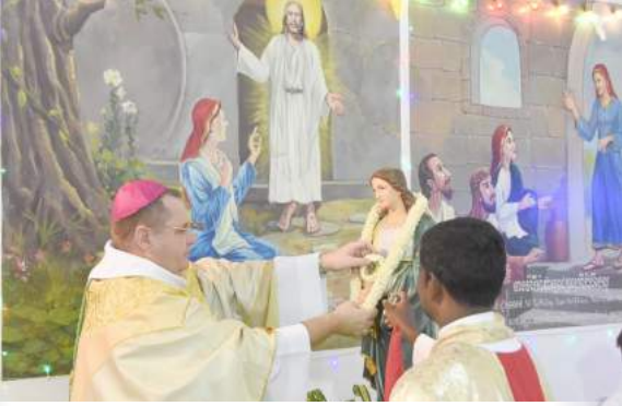
លោកអភិបាល និងបូជាព្រះ បំពាក់កម្រងផ្កាឆ្លុះព្រះនាងម៉ារីម៉ាជាឡា។

ស្រឡាញ់របស់ព្រះយេស៊ូ មានព្រះវិញ្ញាណជីវិតសុទ្ធជំរុញយើង ឲ្យធ្វើជាសាក្សីនិងធ្វើជាគ្រីស្ទបរិស័ទសកម្ម ។ ដោយ ភាសិត