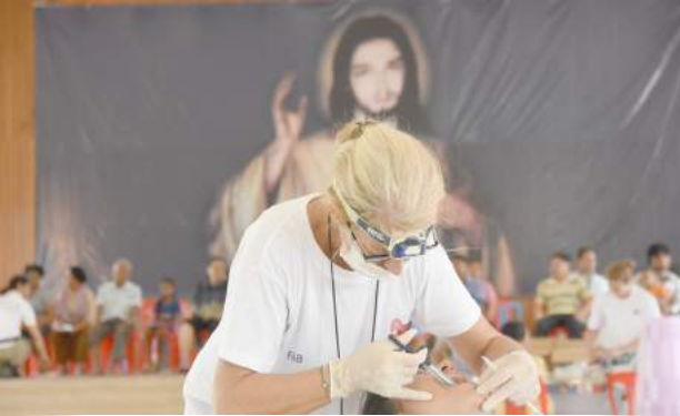
ក្រុមគ្រូពេទ្យព្យាបាលជំងឺជូនប្រជាពលរដ្ឋកម្ពុជា។