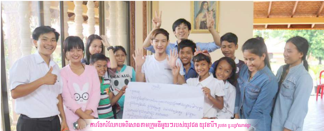
ការចែករំលែកបទពិសោធន៍តាមក្រុមនីមួយៗរបស់យុវជន យុវនារី។

ព្រះវិហារព្រះត្រៃឯក តែងតែយកចិត្តទុកដាក់ទៅលើសកម្មភាពមេត្តាករុណាចំពោះចាស់ជរា អ្នកជំងឺ និងជនក្រីក្រដើម្បីចែករំលែកសេចក្តីស្រឡាញ់ ធម៌មេត្តាករុណា និងលើកទឹកចិត្ត ដោយមិនប្រកាន់សាសនា នៅស្រុកគិរីវង់ ខេត្តតាកែវ ។