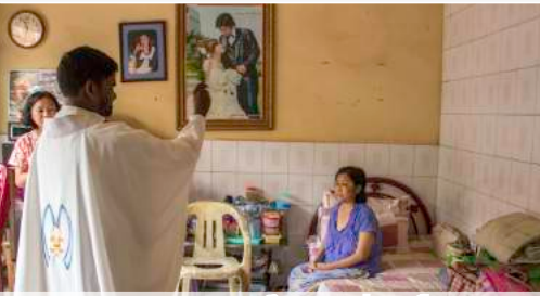
លោកបូជាព្រះទឹកព្រះពរដល់អ្នកជម្ងឺ