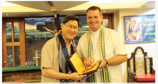
ជំនួបលោកអភិបាលជាមួយលោកកាឌីណាល់ តាកល្លេ