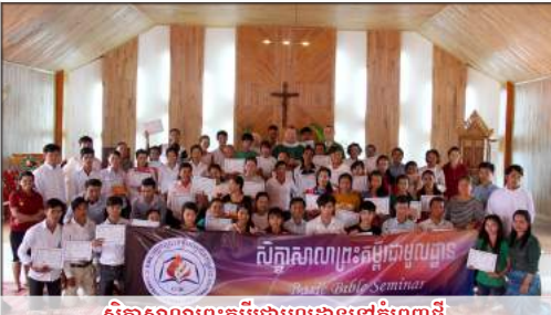
សិក្ខាសាលាព្រះគម្ពីរជាមួយគ្នានៅភ្នំពេញថ្មី