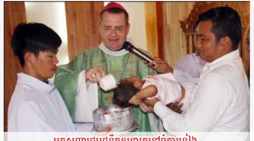
អគ្គសញ្ញាប្រឹក្សាជំនុំកិច្ចការនៅចំការទៀង