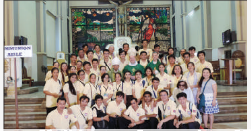
រូបថតអនុស្សាវរីយ៍របស់និស្សិតសាលាសន្តបុត្រជាមួយលោកអភិបាលនៅហ្វែរីយ៉ែ