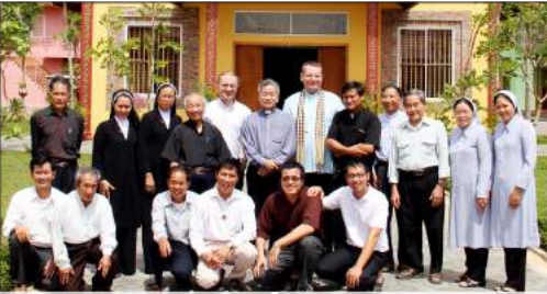
ប្រជុំប្រធានក្រុមបច្ចេកទេសព្រះវិចិត្រនិពន្ធដែលធ្វើការនៅភ្នំពេញ