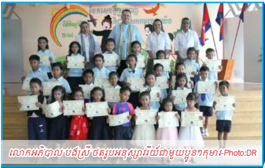
Closure Pre-school and Primary School year

សាលាមត្តេយ្យ និងបឋមសិក្សាសាលាស៊ានដុនបូស្កូ បង្កើតឡើងដោយគោរពទៅលើធនៈ សន្តយូហានបូស្កូ និងអ្នកម្តាយម៉ាសាឡេរ៉ូ ដោយឈានចូលក្នុងប្រទេសកម្ពុជាក្នុងខែតុលាឆ្នាំ១៩៩២ ។ ជាលិស