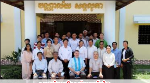
ទស្សនកិច្ចនៅវិទ្យាល័យចម្រើនវិជ្ជា