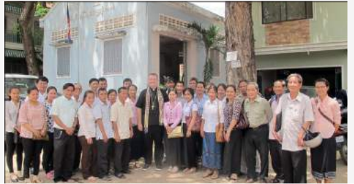
រូបថតជាមួយគណកម្មការព្រះសហគមន៍ចំប៉ា