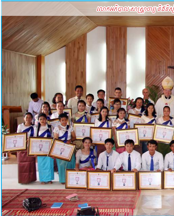
លោកអភិបាល សាស្ត្រាចារ្យ និងនិស្សិត