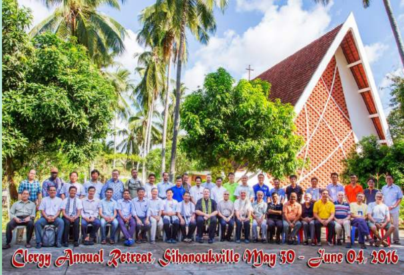
Clergy Annual Retreat, Sihanoukville May 30 - June 04, 2016