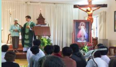
អ្នកជំនំនៅប្រះវិហារសន្តិយុស្សី ឱ្យរួចរាល់សក្ខីភាពអំពីជំនុំ