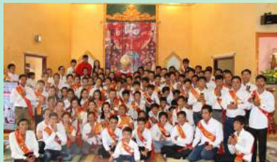
រូបថតអនុស្សាវរីយ៍បេតិកភណ្ឌ-ទទួលអគ្គសញ្ញាណប័ណ្ណនៅចំណី