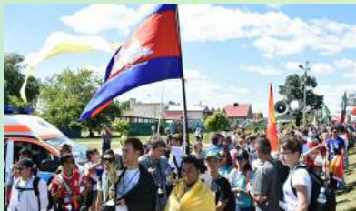
យុវជនកាតូលិក កម្ពុជា ក្នុងទិវាយុវជនពិភពលោក២០១៦ នៅប្រទេសថៃ