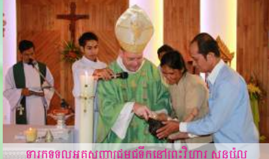
ទារកទទួលអគ្គសញ្ញាបត្រមុនពិធីប្រះវិហារ សន្តិយុស្សី និងសន្តិយុស្សី (ភ្នំពេញ)