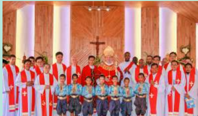
រូបថតអនុស្សាវរីយ៍ក្នុងពិធីប្រសិទ្ធិប្រះវិហារសន្តិយុស្សី និងសន្តិសិលា