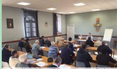
កិច្ចប្រជុំនៃក្រុមអ្នកស្ម័គ្រចិត្ត (មនុស្សធម៌)ជនជាតិចាម