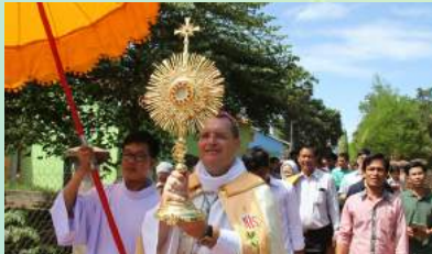
ពិធីហែរព្រះកាយនៅប្រះវិហារសន្តិយុស្សីជំរុញការរៀន