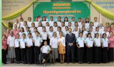
រូបថតអនុស្សាវរីយ៍ក្នុងពិធីចែកសញ្ញាបត្រនៅមន្ទីរសុខាភិបាល