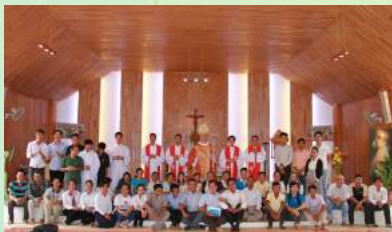
រូបថតអនុស្សាវរីយ៍ក្រុមនិស្សិតសាលាសន្តិយុស្សីនិងនាទី១ និងទី២