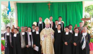
រូបថតអនុស្សាវរីយ៍ខួប១០ឆ្នាំនៃក្រុមគ្រួសាររបបប្រុសស្នាសាណ