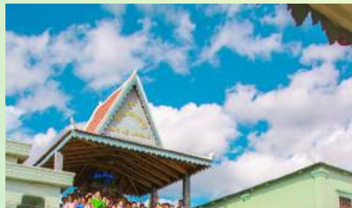
រូបថតអនុស្សាវរីយ៍បេតិកភណ្ឌសកម្មភាពសក្ខីភាពគាតែវ