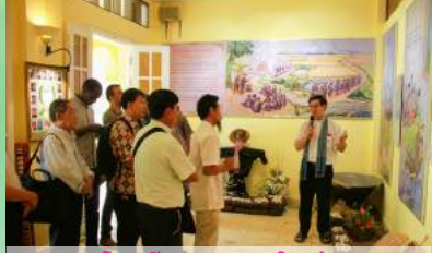
បូជនីយកម្មនៃក្រុមប្រជាពលរដ្ឋភូមិភាគកំពង់ពោធិ៍