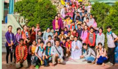
រូបថតអនុស្សាវរីយ៍បេតិកភណ្ឌសកម្មភាពសក្ខីភាពគាតែវ