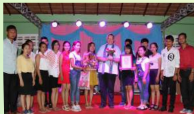
បិទភ្នំសិក្សានៅវិទ្យាល័យសន្តិយុស្សី ខេត្តតាកែវ