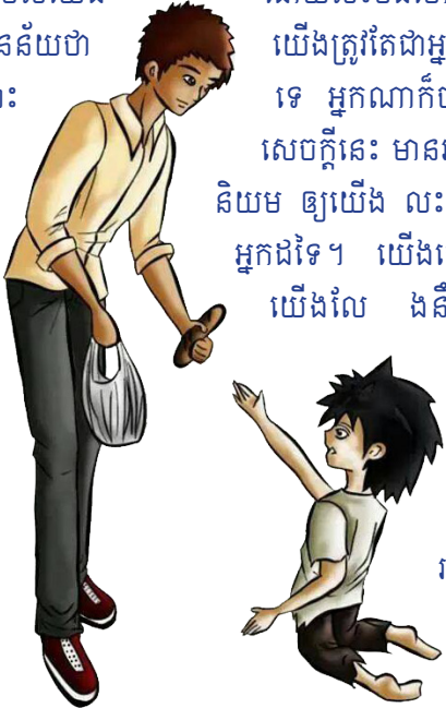
ក្នុងអត្ថបទ (លក ១៨, ២២)

ទីពីរ " អ្នកណាជាអ្នកក្រខ្យត់ អ្នកនោះមានសុភមង្គលហើយ " សម្រាប់យើងទាំងអស់គ្នាវិញគឺ យើងត្រូវការដូរ ចិត្តគំនិតរបស់យើង អ្នកមាន។ សេចក្តីនេះ មិនបានន័យថា នៅក្នុងផ្ទះ ដែលគ្មានជំបូលនោះ ម្ហូបអាហារ គ្រប់គ្រាន់ដែរឬទេ លះបង់ចោល គំនិតសម្ភារៈ ចេះយកចិត្ត ទុកដាក់នឹង ស្រួល របស់យើង នាំឲ្យ ងងឹត ឲ្យយើងគេចមុខ បើកដួងចិត្ត ឲ្យទូលាយ មួយគេវិញ។ យើងមាន លោកឪពុកសុន ជាគំរូមួយ ភ្ញៀវគ្រប់ៗគ្នា។ នេះជា បានណែនាំយើង ហើយសន្ត បញ្ជាក់ថា៖ ជីវិតក្រីក្រ