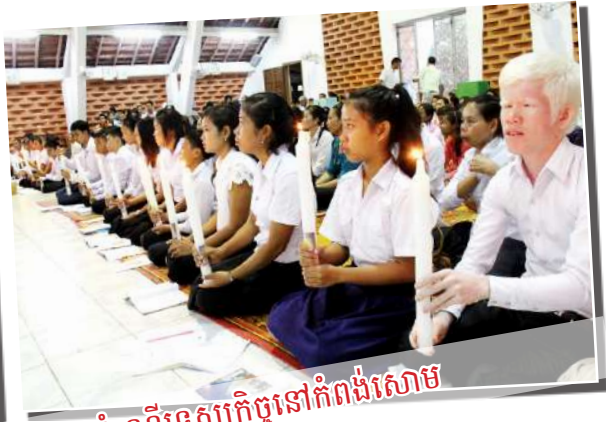
សកម្មភាពរបស់លោកអភិបាលនៅក្នុងដំណើរទស្សនកិច្ចនៅកំពង់សោម