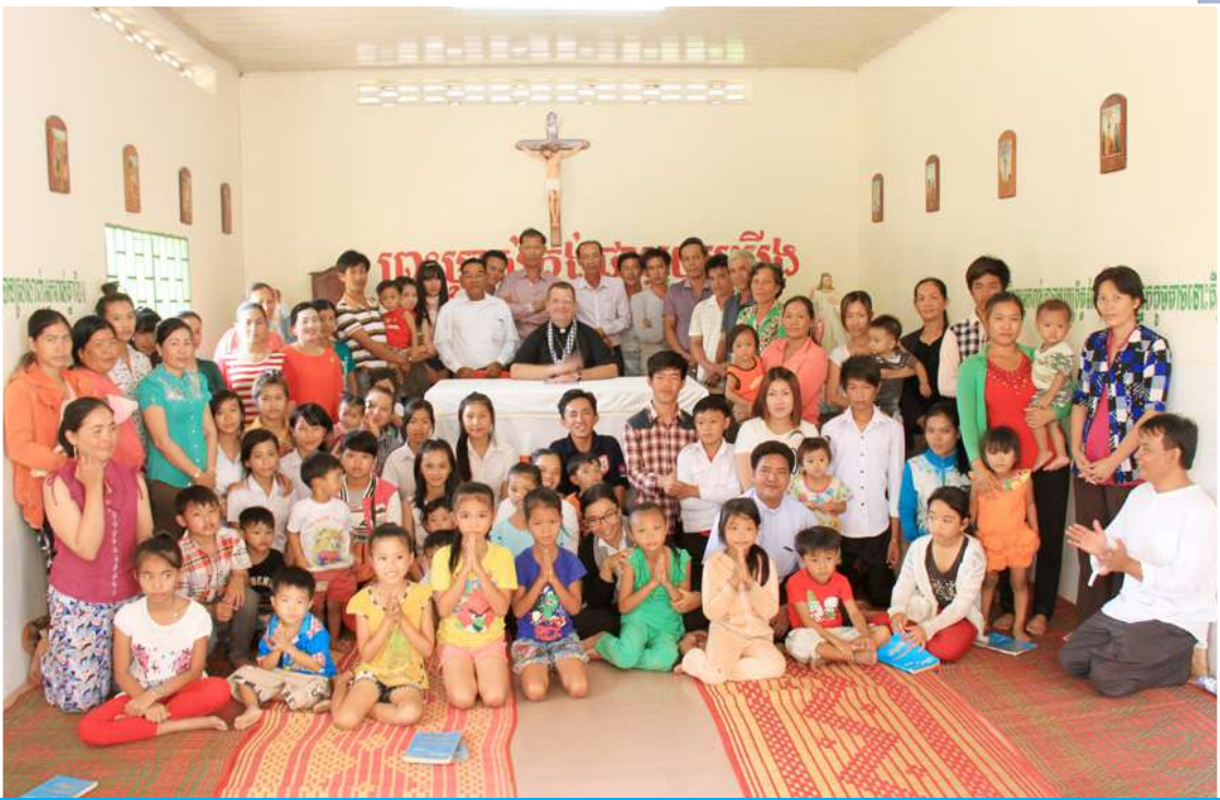
សកម្មភាពរបស់លោកអភិបាលក្នុងដំណើរទស្សនកិច្ចនៅព្រះសហគមន៍ត្រែងក្រយ៉ឹង