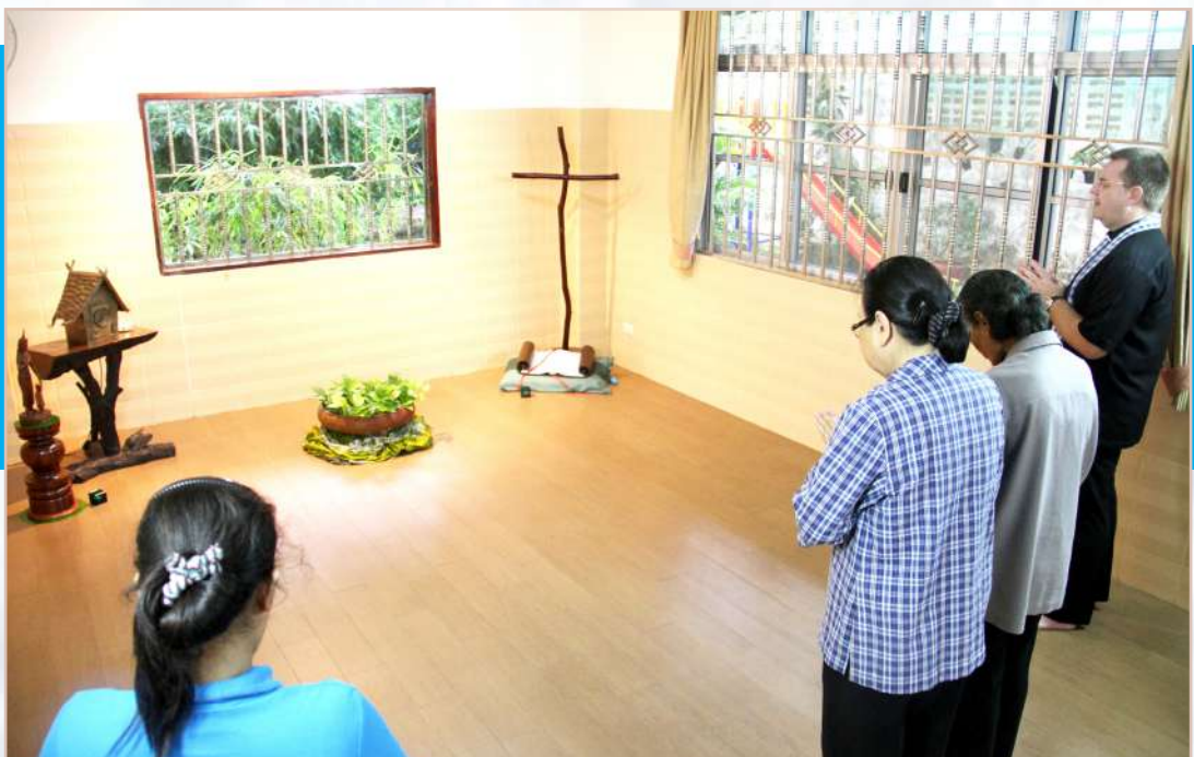
សកម្មភាពរបស់លោកអភិបាលក្នុងដំណើរទស្សនកិច្ចនៅក្រុមគ្រួសារគ្នាលធីសប្បុរស