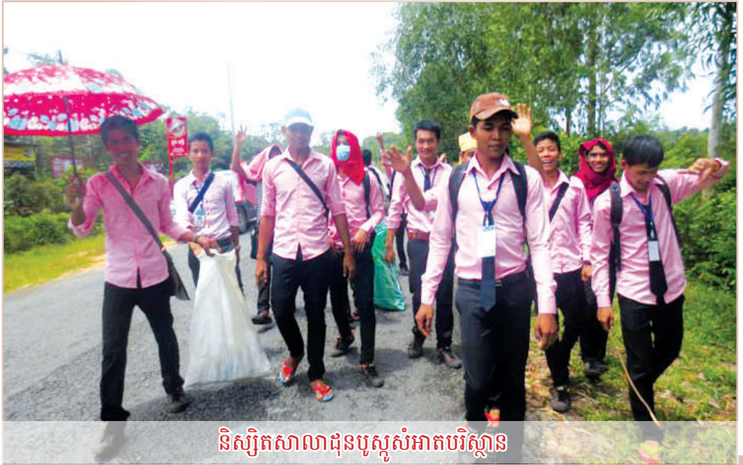
និស្សិតសាលាដុនបូស្កូសំអាតបរិស្ថាន