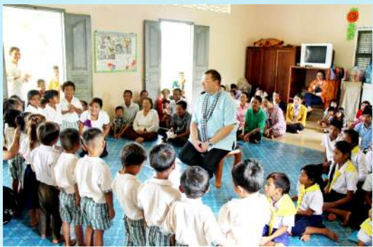
សកម្មភាពរបស់លោកអភិបាលក្នុងដំណើរទស្សនកិច្ចនៅព្រះសហគមន៍ព្រះនាងម៉ារីកោះខ្យង