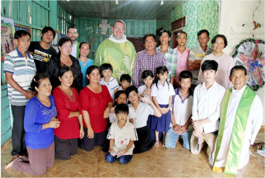
សកម្មភាពរបស់លោកអភិបាលក្នុងដំណើរទស្សនកិច្ចនៅព្រះសហគមន៍ស្រែអំបិល