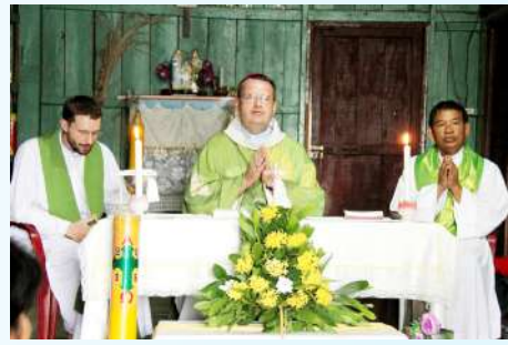
លោកអភិបាល លោកបូជាចារ្យ ថ្វាយអភិបូជារួមគ្នាជាមួយគ្រីស្ទបរិស័ទ