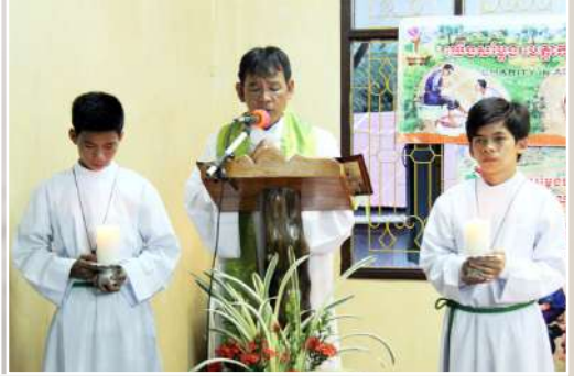
សកម្មភាពរបស់លោកអភិបាលក្នុងដំណើរទស្សនកិច្ចនៅព្រះសហគមន៍កោះកុង