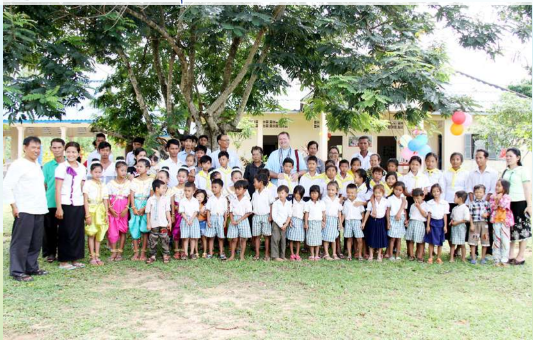
សកម្មភាពរបស់លោកអភិបាលក្នុងដំណើរទស្សនកិច្ចនៅព្រះសហគមន៍ព្រះនាងម៉ារីកោះខ្យង