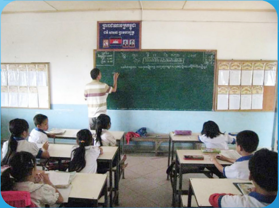
ថ្នាក់ទី២ (ចេនសៀង)