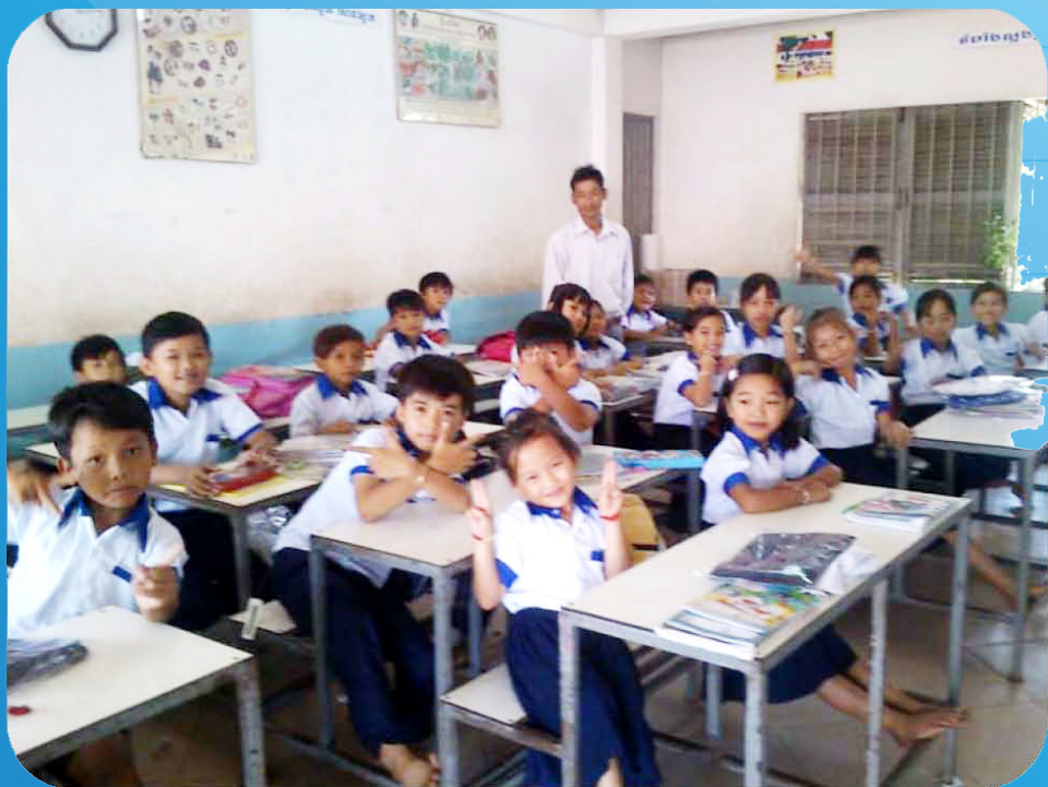
ថ្នាក់ទី១ (សិស្សស្រី)