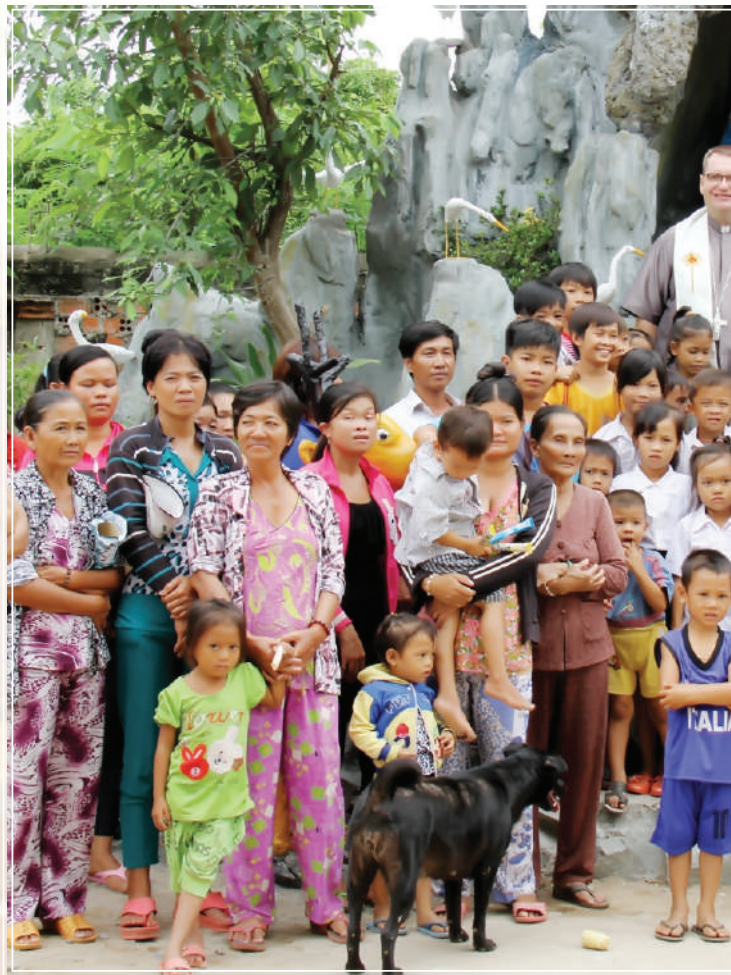
រូបថតអនុស្សាវរីយ៍ក្នុងដំណើរទស្សនា