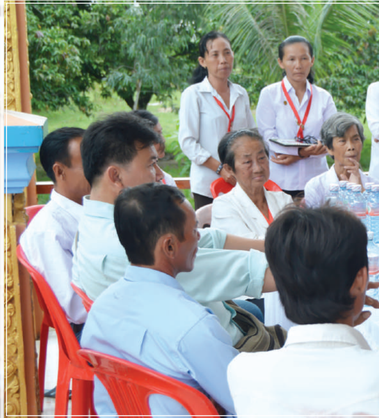
រូបថតអនុស្សាវរីយ៍ក្នុងដំណើរទស្សនា