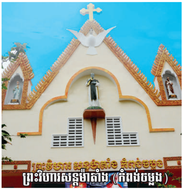
ព្រះវិហារសន្តូម៉ាតាំង (កំពង់ចម្កង)