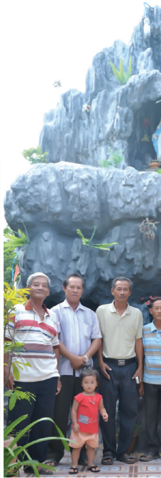
រូបថតអនុស្សាវរីយ៍ក្នុងដំណើរការ