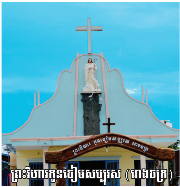
ព្រះវិហារកូនចៀមសប្បុរស (រោងចក្រ)