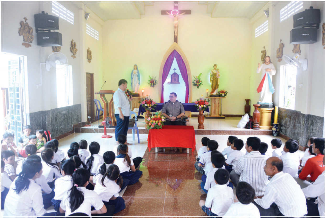
ក្រុមប្រឹក្សាសិស្សវិទ្យាល័យដំណើរការសិក្សា