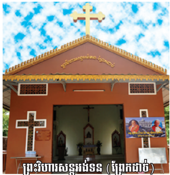
ព្រះវិហារសន្តូអង់ទន (ប្រែកជាប់)