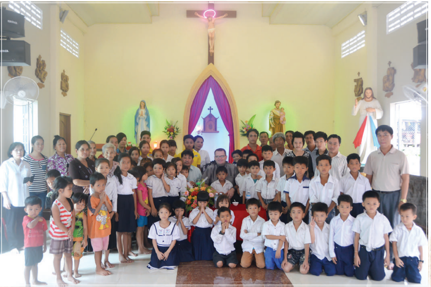
សិស្សានុសិស្សានុវិទ្យាល័យព្រះសហគមន៍កំពង់ចម្រង