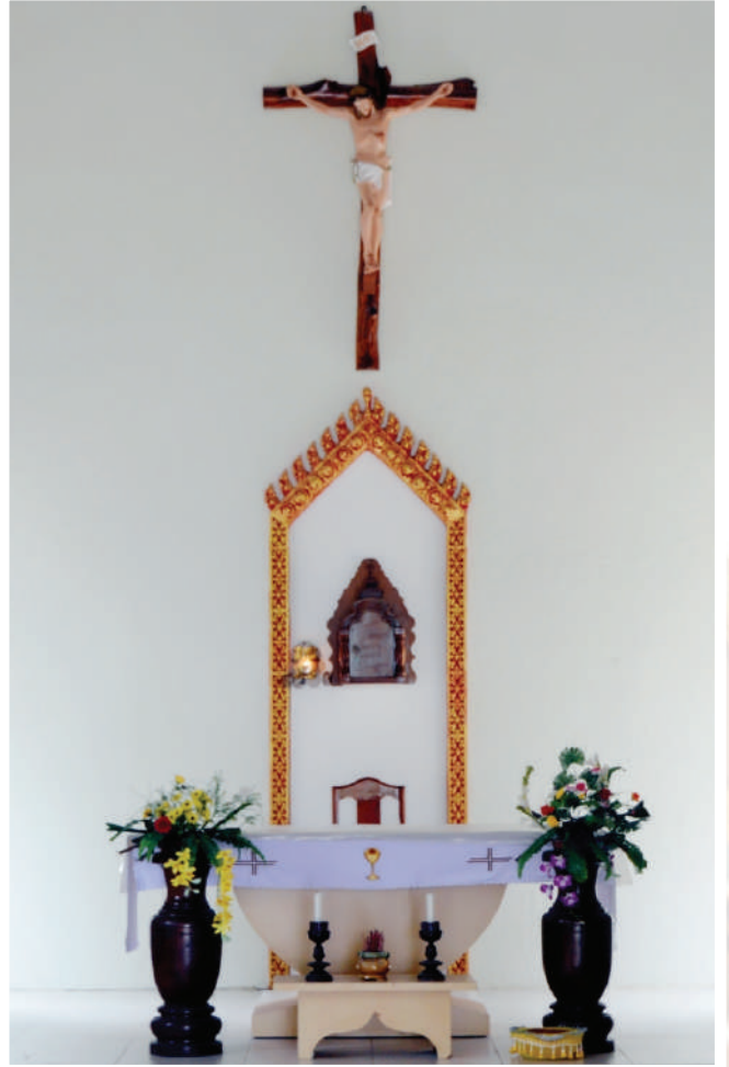
ជួនកិច្ចនៅព្រះសហគមន៍ព្រែកចាម