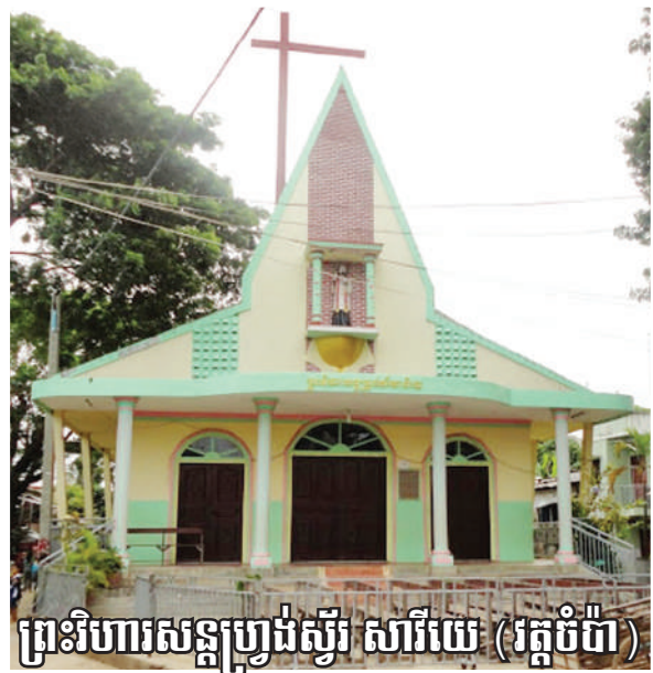
ព្រះវិហារសន្តូប្រៀងស្ទើរ សារីយេ (វត្តចំប៉ា)

website: www.catholicphnompenh.org | Facebook page: Catholic Phnom Penh #25, st.242, Boeung Prolit, 7 makara, Phnom Penh | Tel: 023 224 120. Email: catholicphnompenh@gmail.com