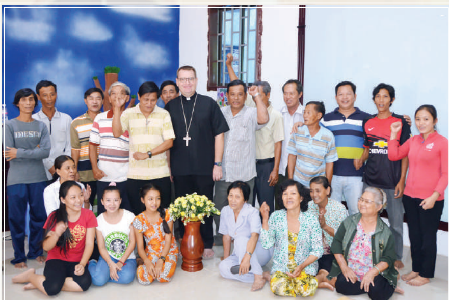
សូនកិច្ចនៅព្រះសហគមន៍ចំប៉ា