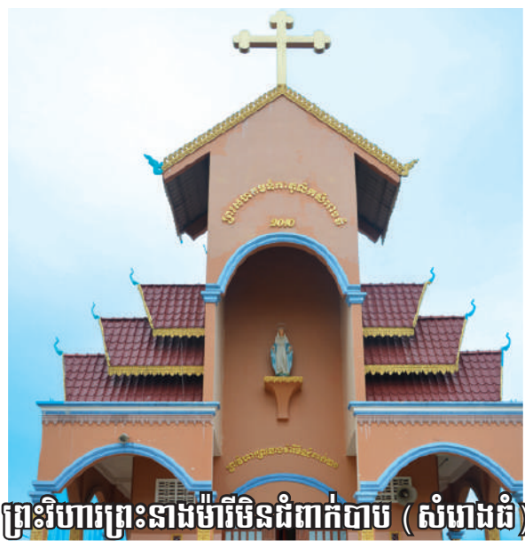
ព្រះវិហារព្រះនាងម៉ារីមិនជំពាក់បាប (សំរោងធំ)