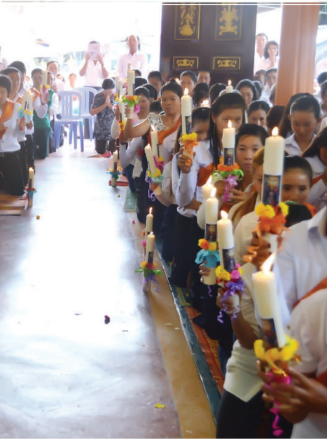
រូបថតអនុស្សាវរីយ៍ក្នុងដំណើរទស្សនកិច្ចនៅ ព្រះសហគមន៍ចំប៉ា