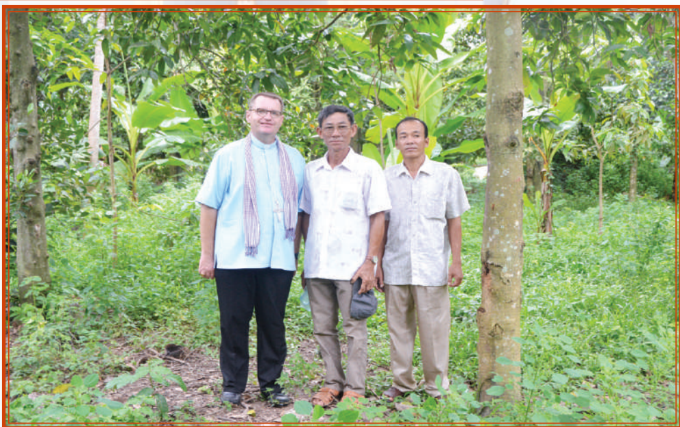
រូបថតនៅលើដីព្រះវិហារ ចាស់ របស់ព្រះសហគមន៍ ផ្លូវត្រី