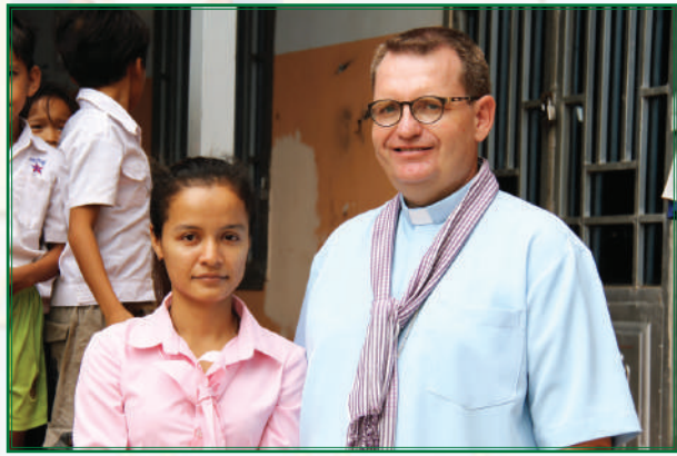
សកម្មភាព ផ្សេងៗនៅក្នុង ព្រះសហគមន៍ ម្ល៉ូត្រី