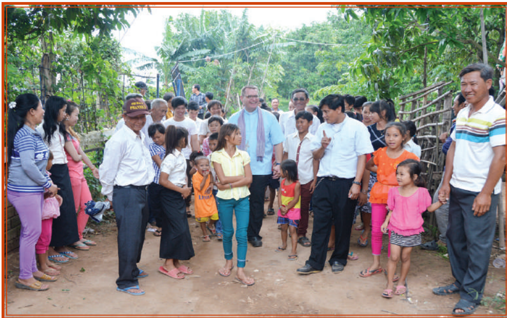
ដំណើរទស្សនកិច្ច នៅក្នុងភូមិជុំវិញព្រះ សហគមន៍ផ្លូវត្រី