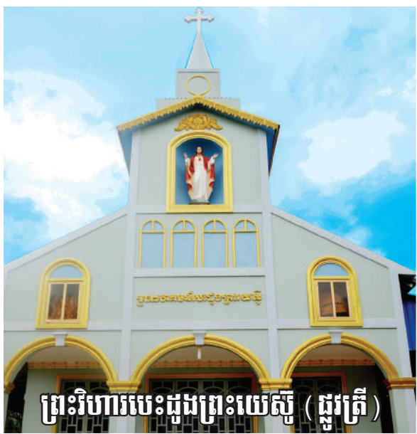
ព្រះវិហារបេះដូងព្រះយេស៊ូ (ផ្លូវត្រី)