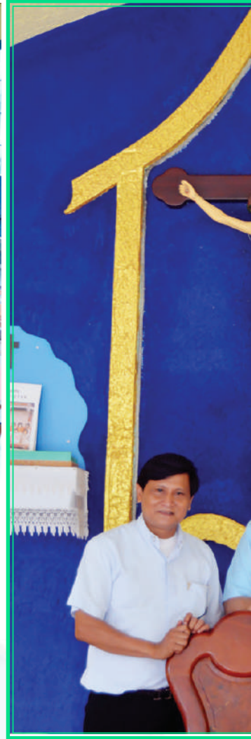
សកម្មភាពផ្សេងៗរបស់លោកអភិបាលជុំវិញដំណើរ ទស្សនកិច្ចនៅព្រះសហគមន៍រោងចក្រ