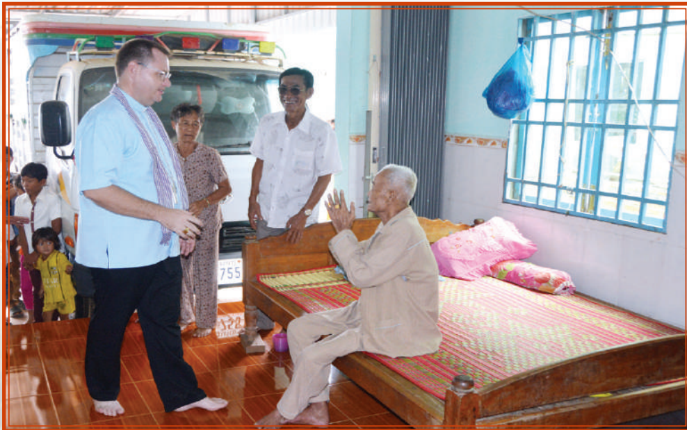
ការចុះសួរសុខ អ្នកជម្ងឺនៅតាមផ្ទះ