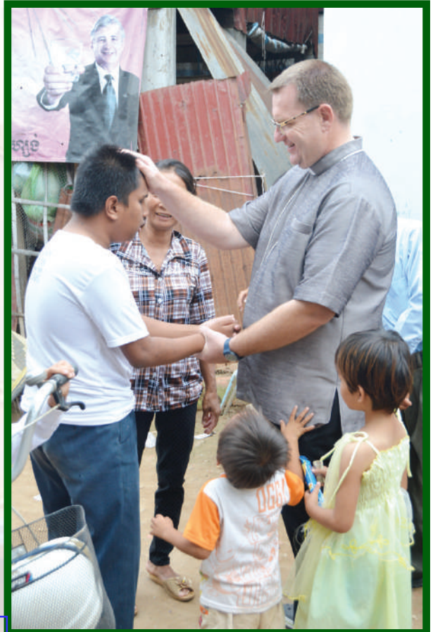
ស្នូលកិច្ចនៅព្រះសហគមន៍សំរោងធំ