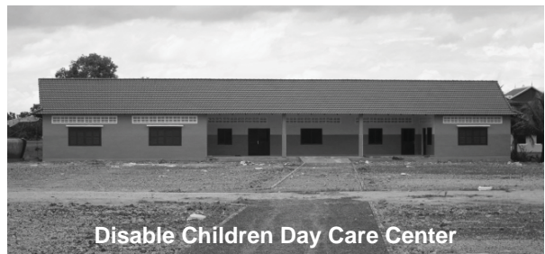
Disable Children Day Care Center