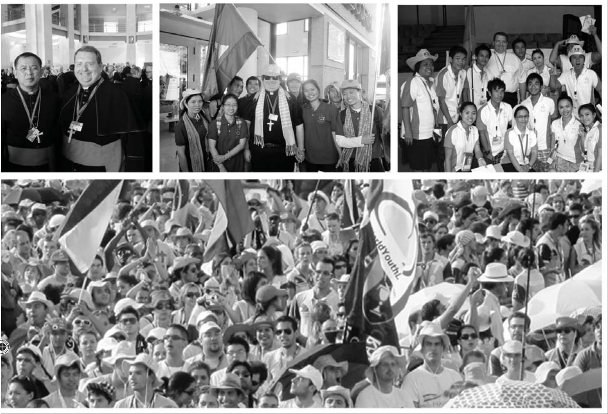
ខាងក្រោមនេះដំណើរមូជនីយចរ នៅទីក្រុងរ៉ូម រៀបចំចិត្តគំនិតចូលរួមទិវាយុវជនពិភពលោក