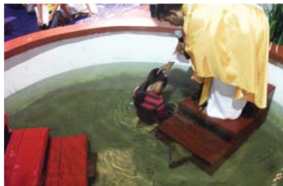
រូបភាពបុណ្យបង្ហូរ នៅមណ្ឌលសកម្មភាពក្រុងព្រះសីហនុ