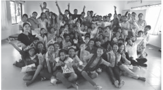
១៤-១៥ មករា ធ្វើនៅមណ្ឌល សកម្មភាពតាកែវ, Takeo Pastoral Centre January 14-15,