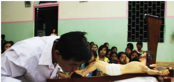
រូបភាពបុណ្យបង្ហូរ នៅមណ្ឌលសកម្មភាពទន្លេមេគង្គ