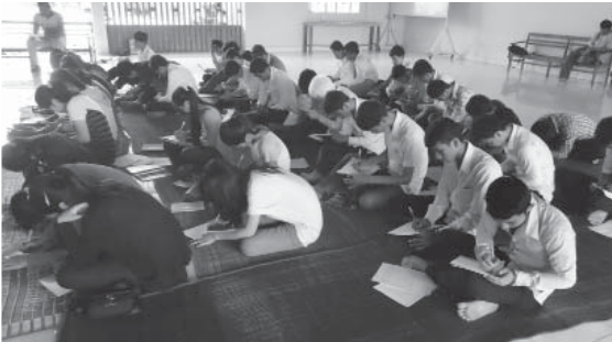
២១-២២ មករា ធ្វើនៅមណ្ឌលសកម្មភាពកំពត, Kompot January 21-22,