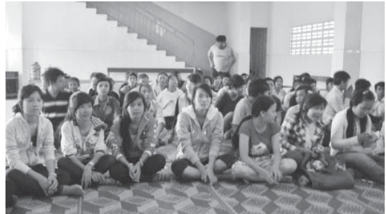
២៨-២៩ មករា ធ្វើនៅមណ្ឌលសកម្មភាពកំពង់សោម, Sihanukville January 28-29,